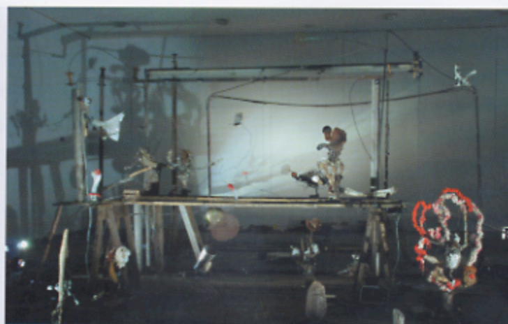
Het technische theater van de Noren.