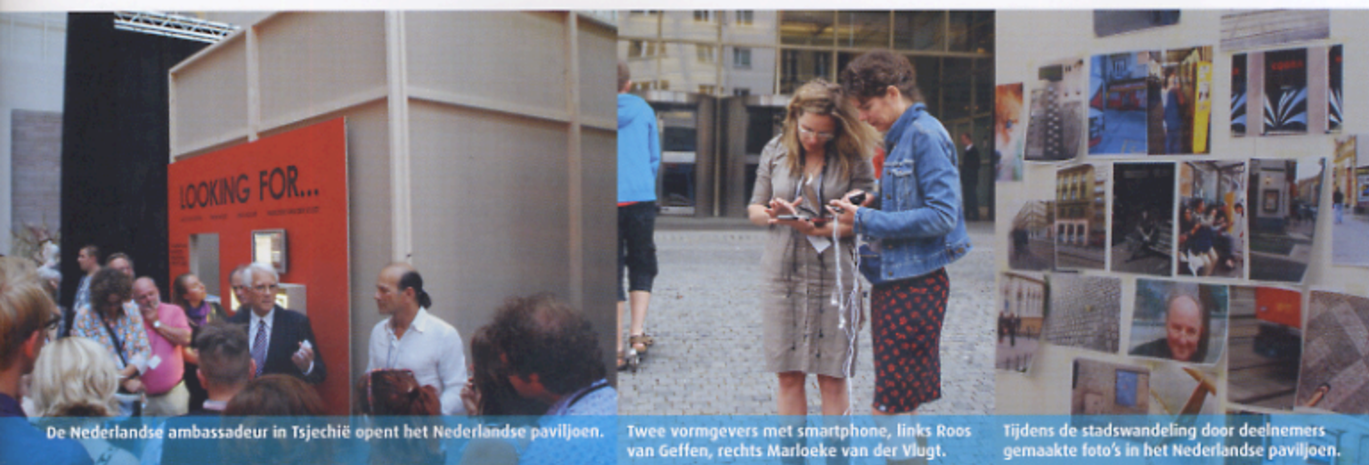
De Nederlandse ambassadeur in Tsjechië opent het Nederlandse paviljoen.